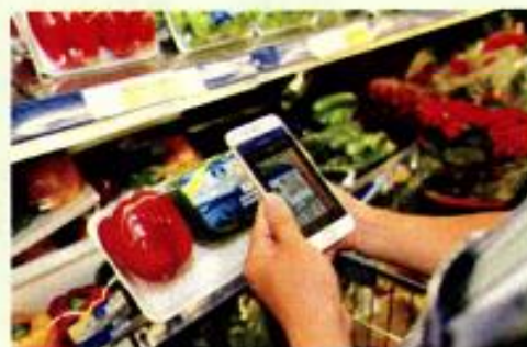
(Ảnh minh họa)

N gày 09/8/2017, Cục Quản lý Thực phẩm và Dược phẩm (FDA) thuộc Bộ Y tế và Phúc lợi (MOHW) của các nước TAIWAN, PENGHU, KINMEN VÀ MATSU ra thông báo số G/TBT/N/TPKM/283 về dự thảo các quy định liên quan đến sửa đổi "Quy định Kiểm soát truy nguyên nguồn gốc thực phẩm và các sản phẩm liên quan" nhằm mục đích thông tin đến người tiêu dùng.