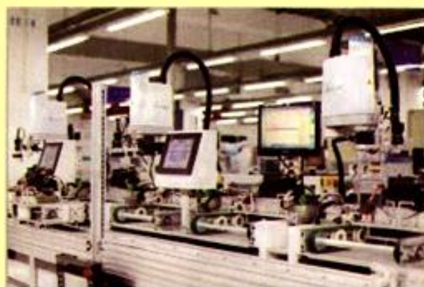
(Ảnh minh họa)