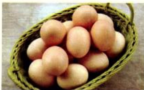
(Ảnh minh họa)

Nội dung thông báo: Mục đích của sửa đổi này là xác định các đặc tính cần lưu ý trong bao bì, bảo quản, cất giữ, vận chuyển, tiếp thị và các biến thể có liên quan đảm bảo hợp vệ sinh theo công nghệ của trứng được che chở (bảo quản) trong điều kiện như Gà đẻ.