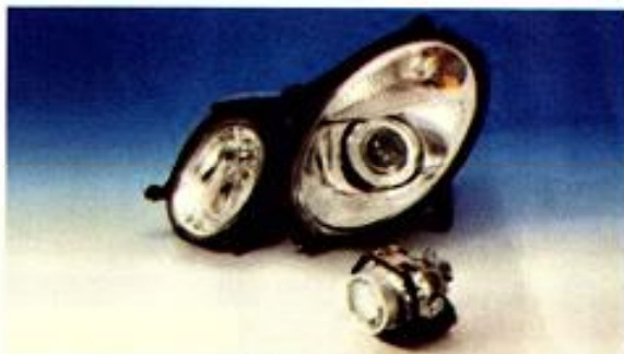
(Ảnh minh họa)

Thông tin chi tiết: Http://www.denatran.gov.br/ .